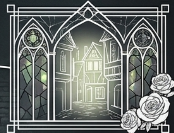
4. Katu 8, Rakennus 7 Valkeasydänten salainen turvapaikka.