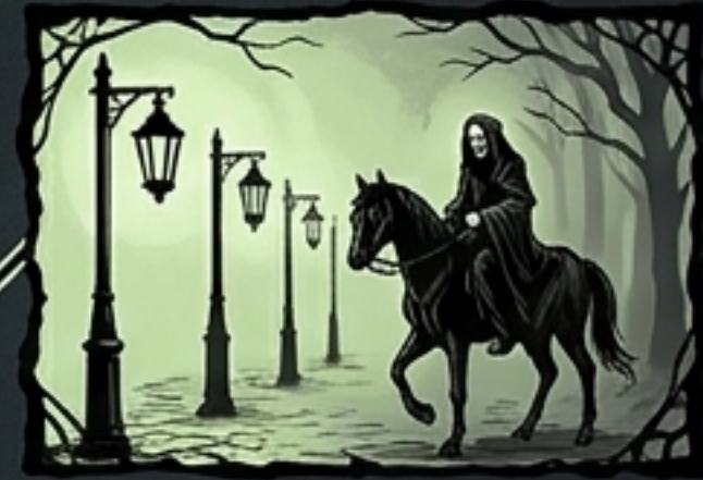
3. Katulyhdyt Pitkiä, mustia lyhtyjä, joita syyttää iltaisin mustaan viittaaan pukeutunut, huienen olento mustan hevosen selässä.