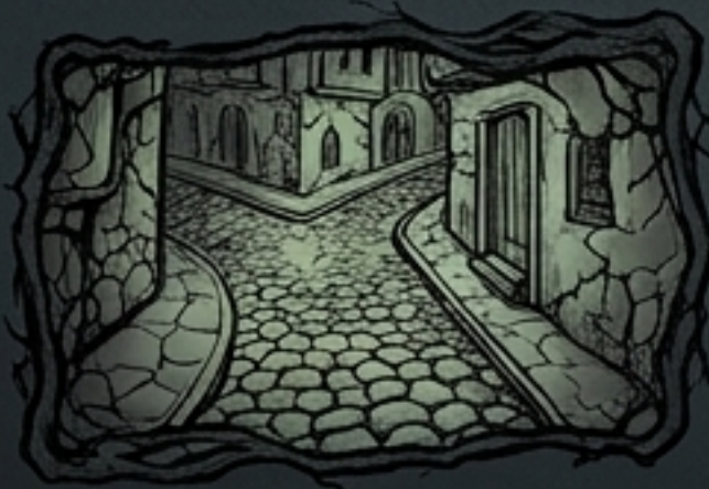
2. Keskiaikaiset mukulakivikadut Varjojen ja vaanivien olentojen metsästysmaa.