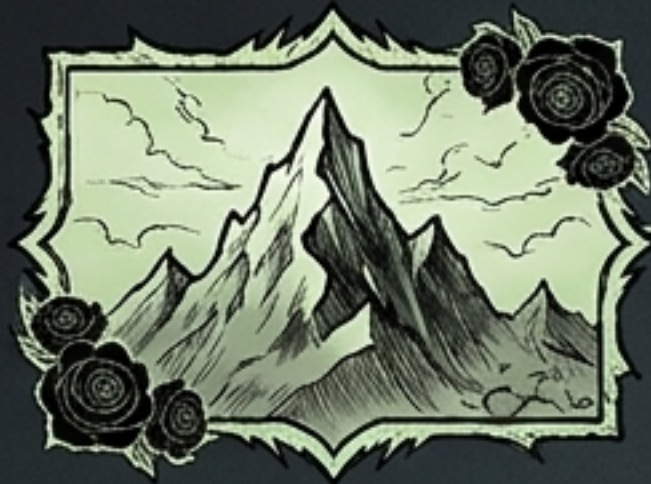
1. Sumuvuori Noidan ja kirouksen alkukoti.

Tila ja valo ovat kylässä tarkkaan rajattuja hyödykkeitä. Asukkaiden reitit määräytyvät valonlähteiden ja varjoissa piilevien uhkien mukaan.